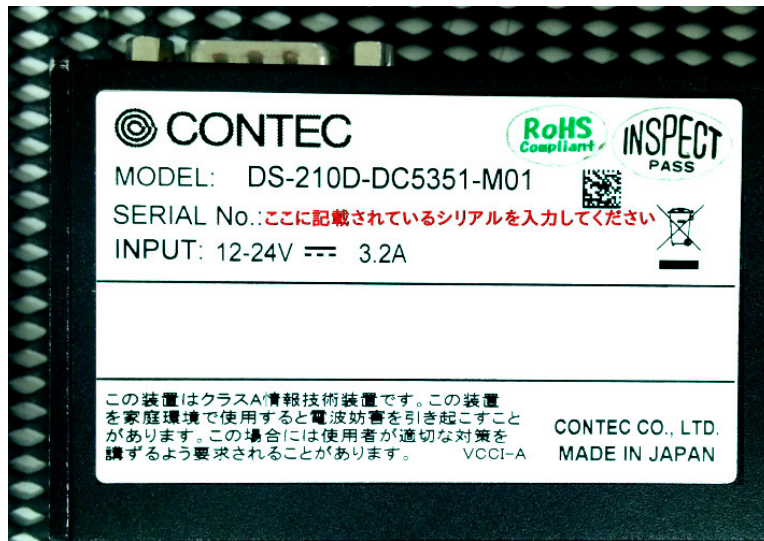
図2. サイネージ製品における製品底面に記載されるシリアル番号のイメージ